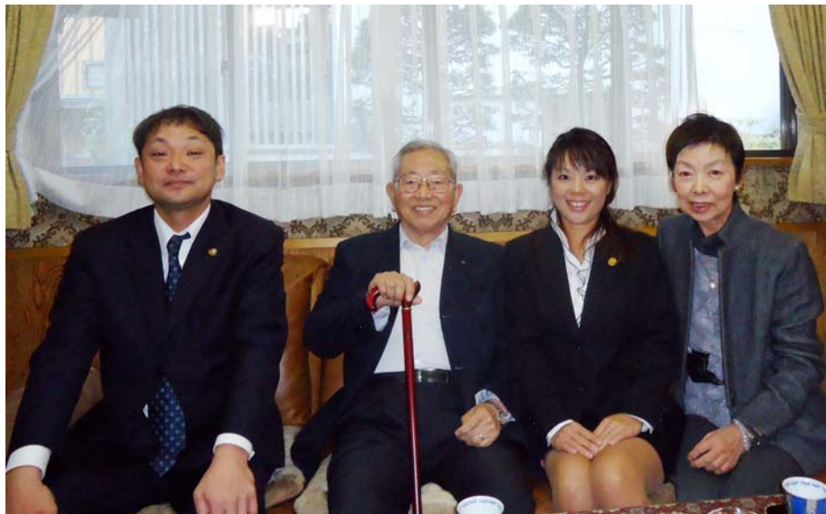
武市会員ご自宅訪問