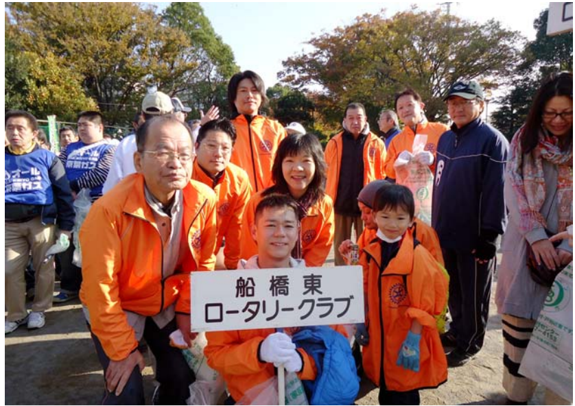
船橋をきれいにする日 ごみ拾いお疲れ様でした。